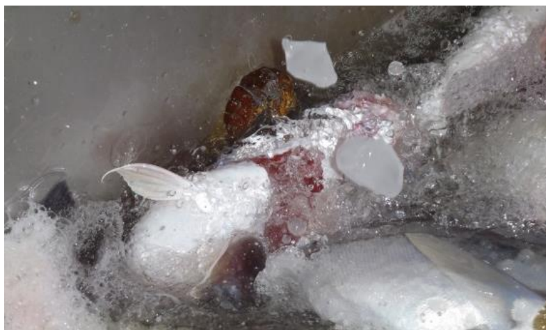
Figur 1. Fisk i bulk tank med tilsetning av isslurry

Resultatene av arbeidet viser en forbedring av superior andel klippfisk på 5 % når torsken var behandlet med isslurry i utblødning- og bulk tanker og høyere vanngjennomstrømming i utblødningstanker om bord sammenlignet med normalproduksjon. Høyere vanngjennomstrømming i utblødningstanker gir også mindre blodfeil/fargefeil på torsken når den er produsert frem til klippfisken.